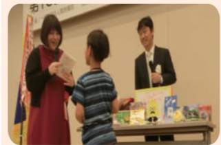
※9路講座の参加者は抽選の対象外です。

さらに参加チームの全員を対象にした抽選会を行うよ! 運が良ければ豪華賞品が当たるかも?